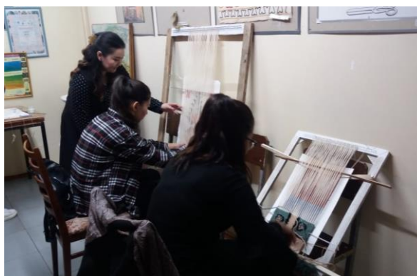
Гобелен тоқу барысы

Халық арасында «Жаман оқытушы ақиқатты өзі айтып береді, ал жақсы оқытушы студенттің өзін ізденуге жетелейді, ойлауға үйретеді», - деген пікір қалыптасқан. Сабақ барысында студентпен оқытушының арасында ерекше қарым қатынас