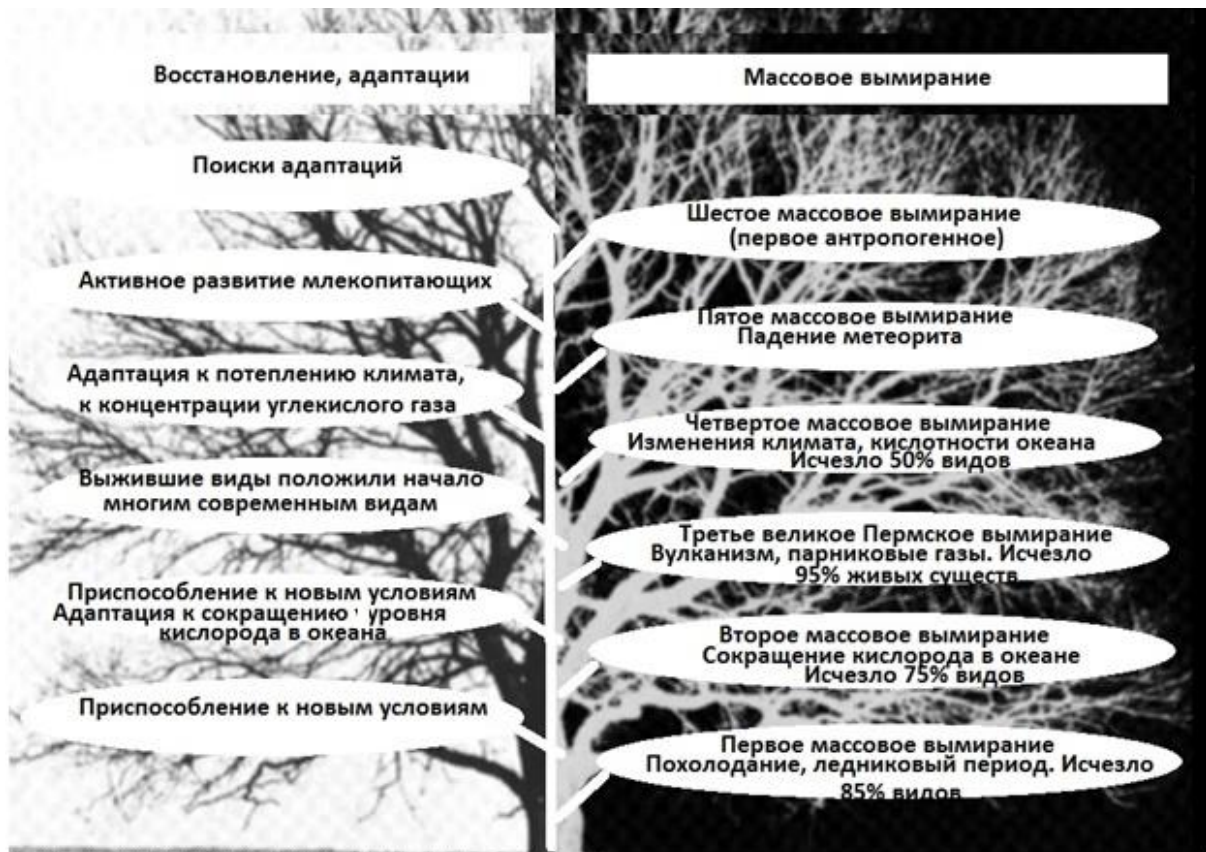
Рис. 3. Древо массовых вымираний и приспособлений природы к новым условиям. Справа - вымирания, слева - последующие восстановления

В ходе эволюции растет целесообразность созданий живой природы, и их красота. Можно сравнить красоту первобытных растений – хвощей, плаунов, животных – ящеров, динозавров, с современными красивыми растениями (рис. 4) и животными (рис. 5). Красота многих современных животных безусловна, она является и признаком их целесообразности, и выживаемости. Нами были