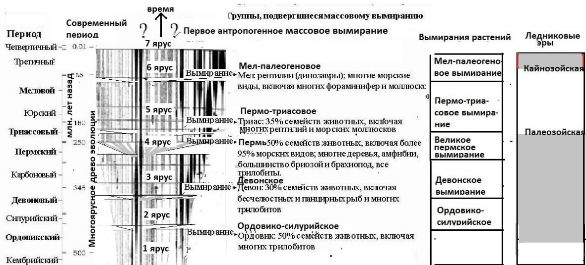
Рис. 1. Многоярусное древо эволюции: периоды массового вымирания и восстановления (показаны условно ввиду отсутствия точных данных о размерах)

Сейчас впервые началось антропогенное вымирание видов: его можно назвать шестым массовым вымиранием. Это отмечают многие исследователи. Например, на это указала группа исследователей из Стэнфордского университета: 515 видов животных находится сейчас на грани полного исчезновения. Отмечается, что за XX век на планете исчезло 543 вида наземных позвоночных. По их мнению, вымирание происходит гораздо быстрее, чем считалось до сих пор.