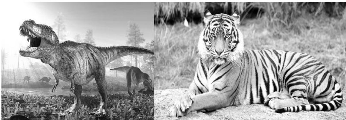
Рис. 5. Древний (слева) и современный хищник

Параллельно с этими законами действует предложенный нами закон роста степени искусственности жизни и среды человека. С древних времен человек создает искусственную среду, окружает себя искусственными предметами, ландшафтами. Основная цель этого – удовлетворение все более расширяющегося круга потребностей, и в то же время – отдаление от своего животного происхождения, от биологической сущности, подчеркивание своего принципиального отличия от остального мира живой природы. Искусственная среда во многом помогла развитию человечества, повышению качества жизни. Но постепенно, по мере ее глобального расширения, искусственность среды и жизни проникла во все области деятельности человека и стала оказывать негативное влияние на его развитие. Рост искусственности всех областей жизни опасен для развития человечества, в первую очередь разрывом естественных связей между воздействиями и реагированием, и должен быть заменен естественным развитием в естественной среде.