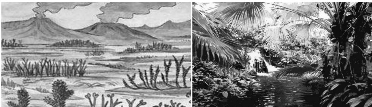
Рис. 4. Бедная древняя (слева) и разнообразная (справа) современная флора

предложены законы роста красоты живой природы, и эволюционного снижения мощности органов нападения и защиты животных [3]. Неуклюжие из-за толстых "доспехов" панцирные рыбы, саблезубый тигр с торчащими из пасти клыками; малоподвижные динозавры с нелепо выглядящими щитами "брони", и т.д., - это первые шаги эволюции.