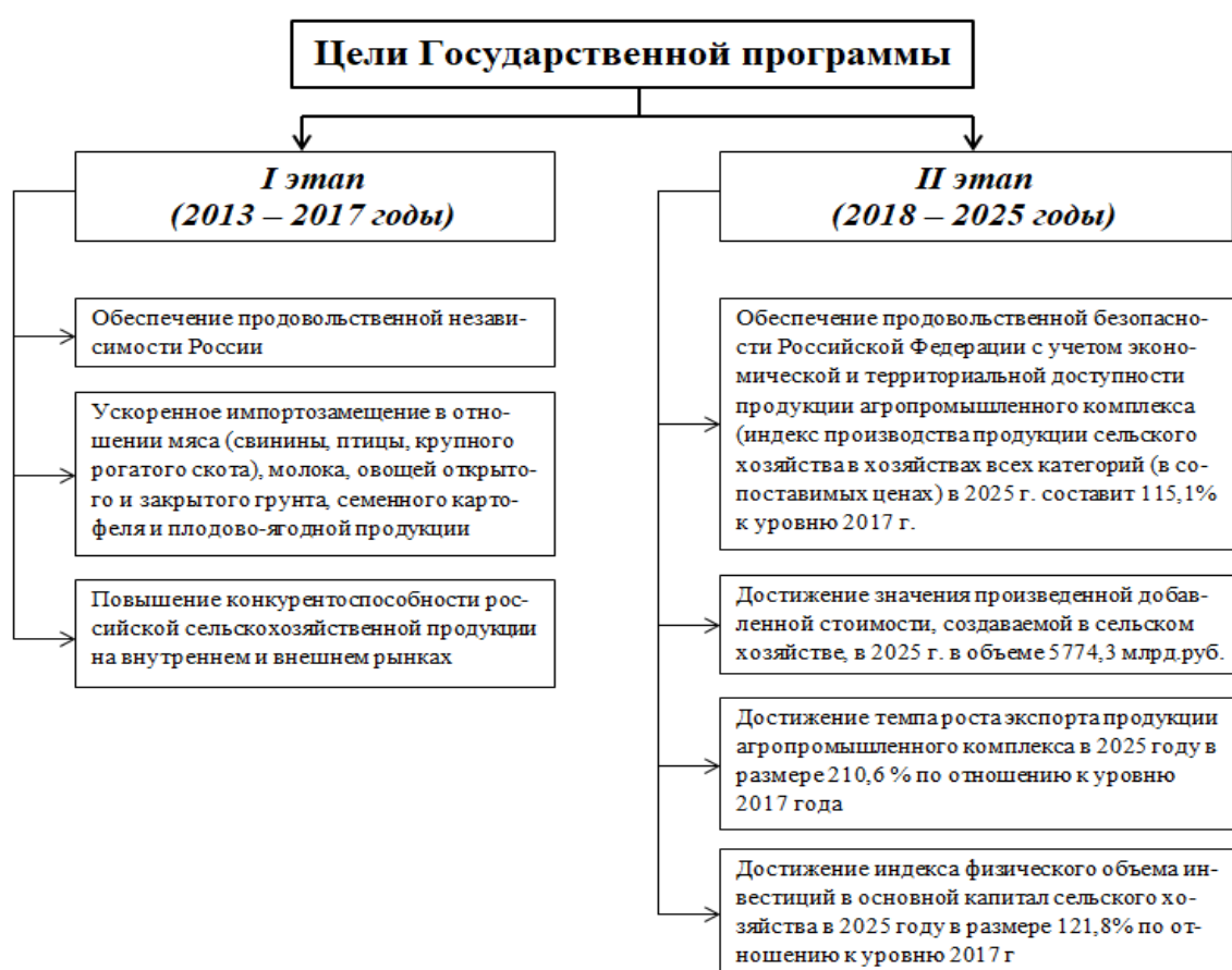
Рисунок 1 – Цели государственной программы [1]

Кондитерская промышленность является прямым потребителем ряда сельскохозяйственной продукции, что коррелирует её с другими отраслями агропромышленного комплекса России. Поэтому в первую очередь стоит рассмотреть государственную программу развития сельского хозяйства. Данный документ направлен на обеспечение развития агропромышленного производства страны. Основные цели программы и их назначение по годам реализации представлены на рисунке 1.