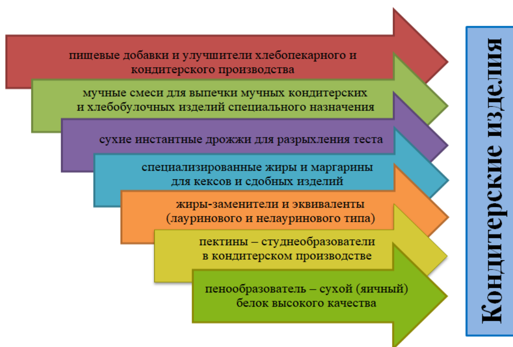
Рисунок 4 – Иностраные составляющие рецептуры изделий кондитерской промышленности, подлежащие замене на российские аналоги [7]

Следует отметить, что российские производители вполне готовы к тому, чтобы обеспечить замену части компонент в составе как сахаристых изделий, так и мучных (см. рисунок 4).