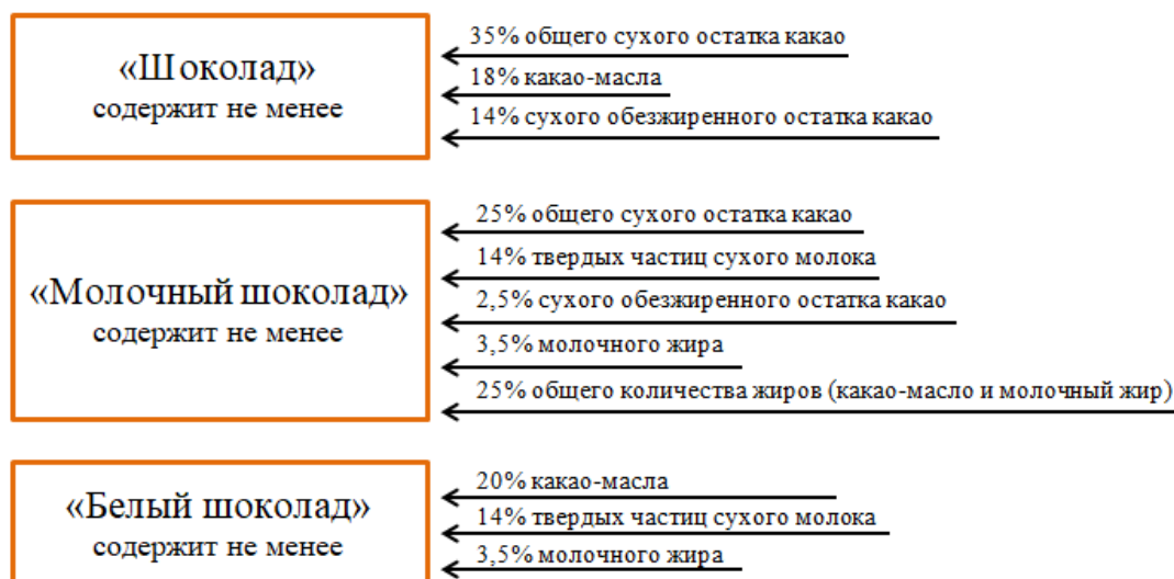
Рисунок 3 – Химические показатели шоколада (Директива 2000/36/ЕС) [4]

Химические показатели, установленные в зарубежной директиве для продукции «шоколад», «молочный шоколад» и «белый шоколад» совпадают с нормами ГОСТ 31721-2012 за исключением небольшой разницы в минимально допустимом содержании массовой доли сухого обезжиренного остатка молока и молочного жира для молочного шоколада. В России данные показатели равны 12% и 2,5%, а в странах Европейского союза – 14% и 3,5 соответственно. Однако в директиве 2000/36/ЕС существует пункт, который гласит, что наименования товара «шоколад», «молочный шоколад», могут быть дополнены информацией или описанием, касающимися критериев качества, при условии, что продукты содержат: