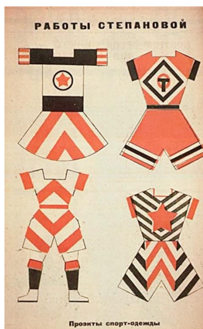
Рисунок 2. В. Степанова. Эскизные разработки спортивных костюмов

Она основывалась на художественном решении внешнего оформления, упрощении формы делении ее на пропорциональные блоки, в то время как европейских модельеров больше интересовало внедрение новых материалов, таких, как трикотажное полотно, и функциональность в применении.