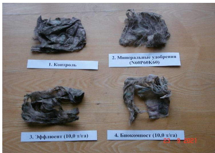
Рисунок 2. Интенсивность разложения целлюлозы при изучении последствий внесения мелиорантов в дерново-подзолистую супесчаную почву на вариантах лизиметрического опыта, 2021 год

Результаты изучения последствий применения эффлюента и биокомпоста на высоту растений и урожайность однолетних трав при выращивании на дерново-подзолистой супесчаной почве представлены на рисунках 3 и 4.