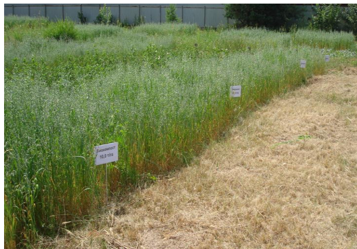
Рисунок 1. Варианты лизиметрического опыта перед учетом урожая однолетних трав на дерново-подзолистой супесчаной почве (Рязанская область, д. Полково, 2021 год)

В начале вегетационного сезона в лизиметрах был также заложен эксперимент по изучению влияния испытуемых мелиорантов на биологическую активность дерново-подзолистой супесчаной почвы аппликационным методом: определение интенсивности разложения целлюлозы по общепринятой методике [6]. Длительность эксперимента 3 месяца, оценка интенсивности разрушения клетчатки проведена по шкале, предложенной Д.Г. Звягинцевым (рисунок 2).