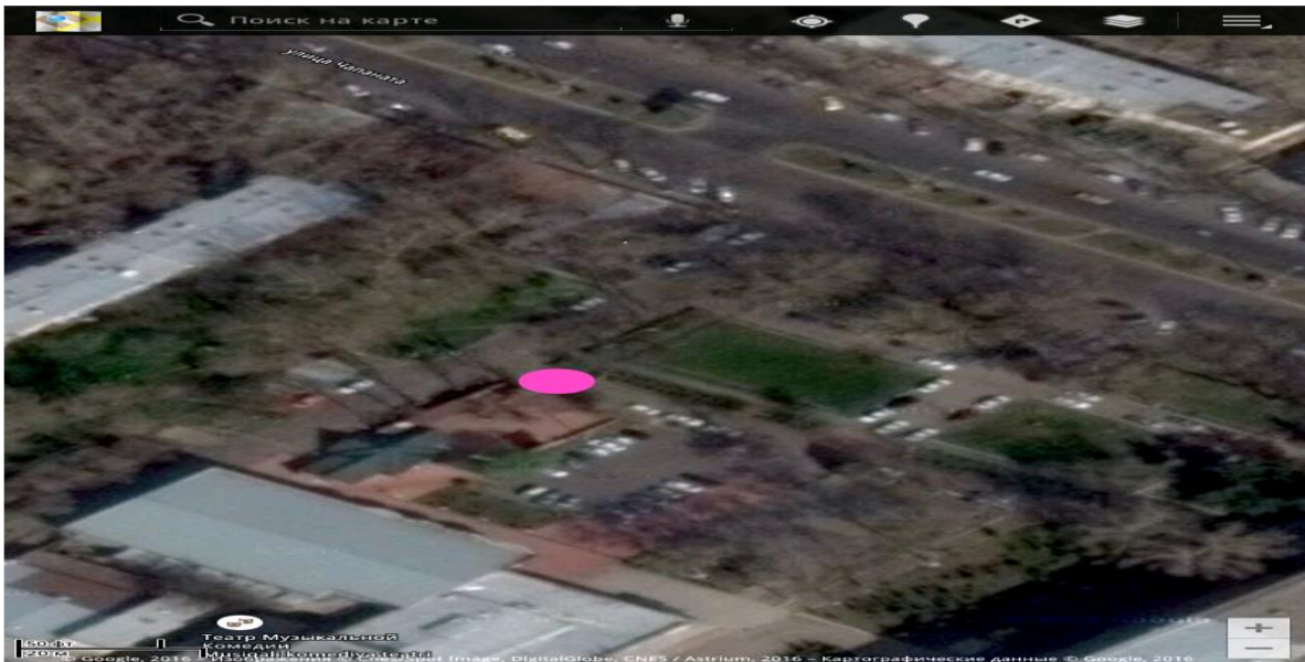
Рисунок 3. – Процесс отбора образца возле кафе Теремок

По результатам лабораторных исследований на присутствие «Кадмия» в атмосферном воздухе города Ташкента были получены следующие результаты. г.Ташкент Чиланзарский район: