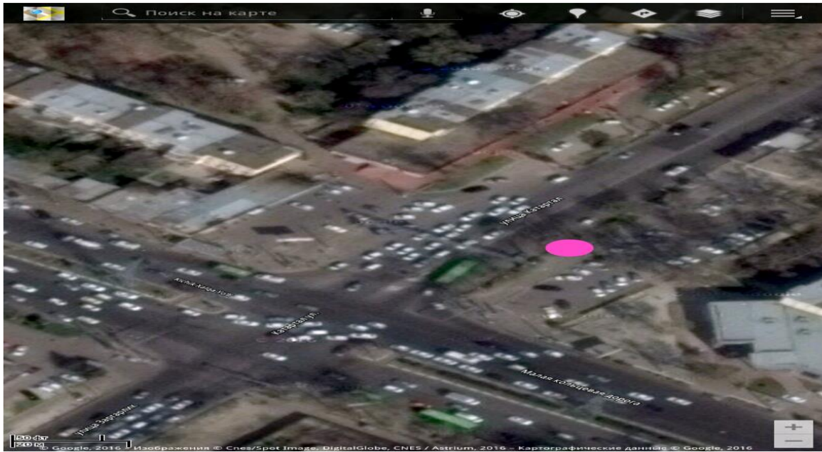
Рисунок 2. – Перекрёсток Шухрата вид на карте